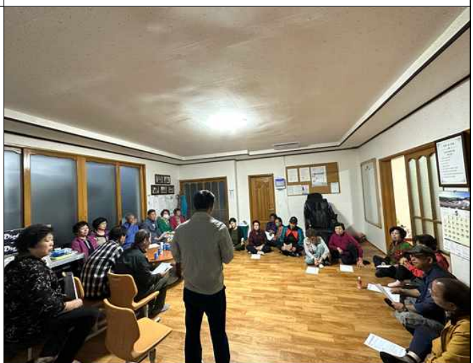
기숙사 위치변경 부지 주민설명회(23.5.8)