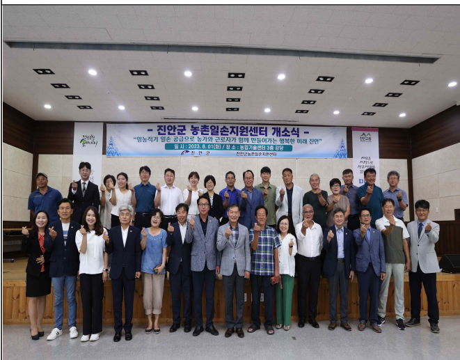
진안군 농촌일손지원센터 개소(2023.8.)