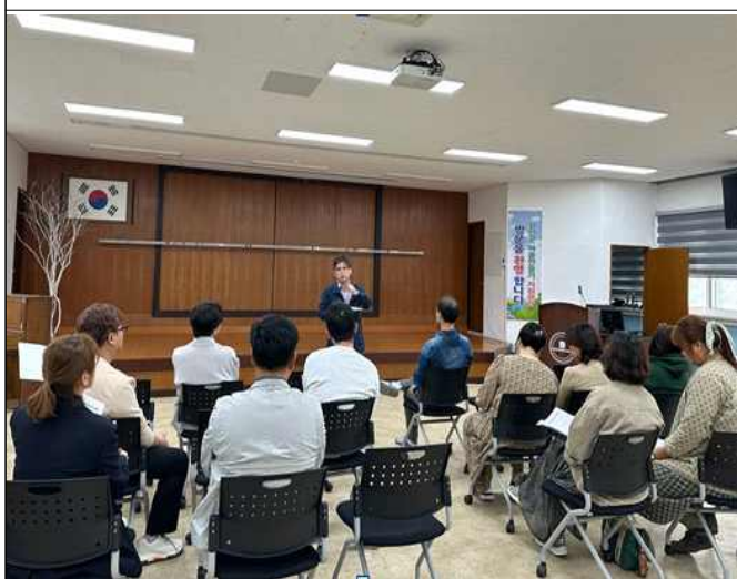
기숙사 위치변경 부지 주민설명회(23.4.13)