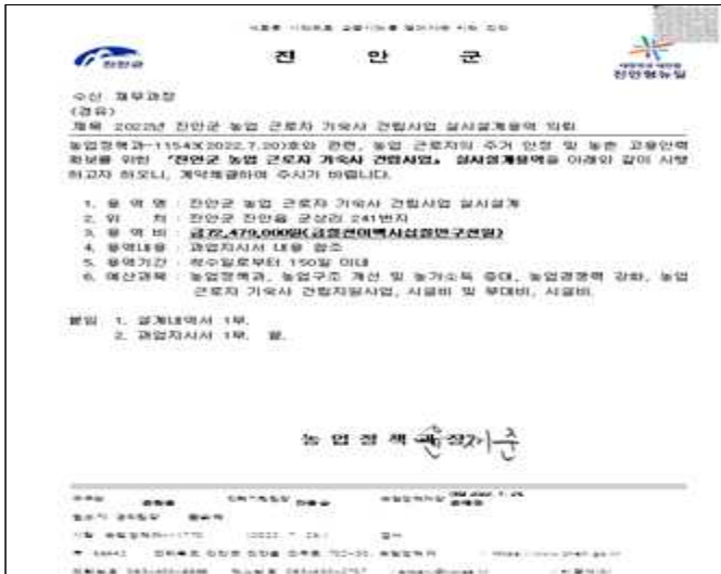
기숙사 건립 실시설계 용역 의뢰(22.7.26.)