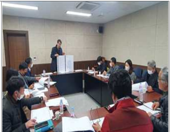
기숙사 실시설계에 따른 착수보고회(22.11.29.)