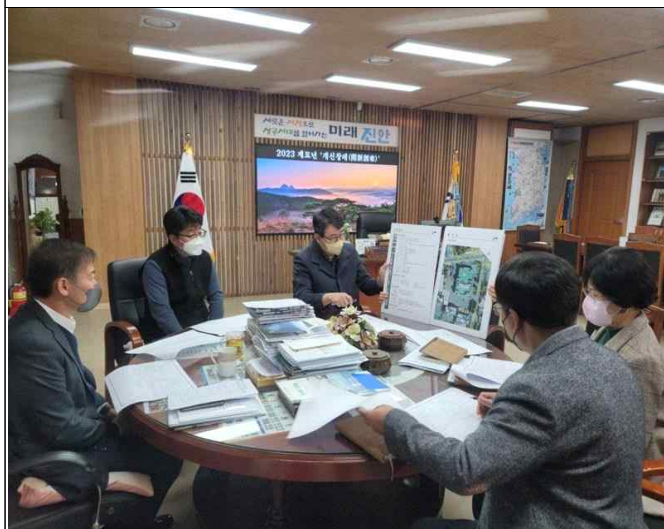
기숙사 실시설계에 따른 중간보고회(23.1.18.)