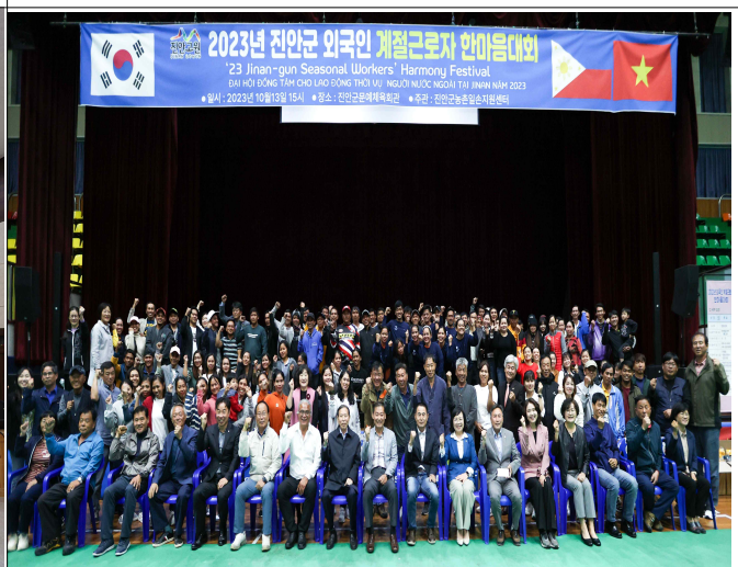
진안군 농촌일손지원센터 운영(외국인 계절근로자 이탈방지 및 화합을 위한 한마음대회 개최(2023.10.))